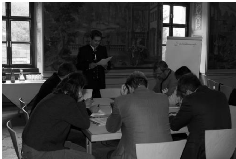
Workshop dans le cadre du projet ECONNECT à Admont en Autriche, octobre 2008.